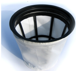
Filter iz tekstila