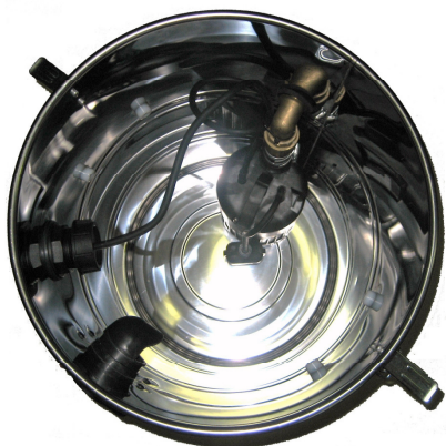
Rezervoar sesalnika s črpalko